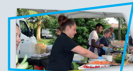
Barbecue des 3 parcs